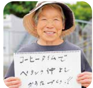
(取材協力: 勸興ペタンク会)