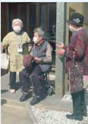
ネームカードをつけて訪問

中原校区老連では、こうした活動を効果的に実施できるよう毎年地区の民生委員のみなさんと友愛活動員全員での連絡会議を開催し効果を上げています。(ここ三年はコロナで実施できません。今後とも伝統ある友愛活動で、地域支え合い事業などに広く貢献できるように、会員一同邁進するつもりです。)