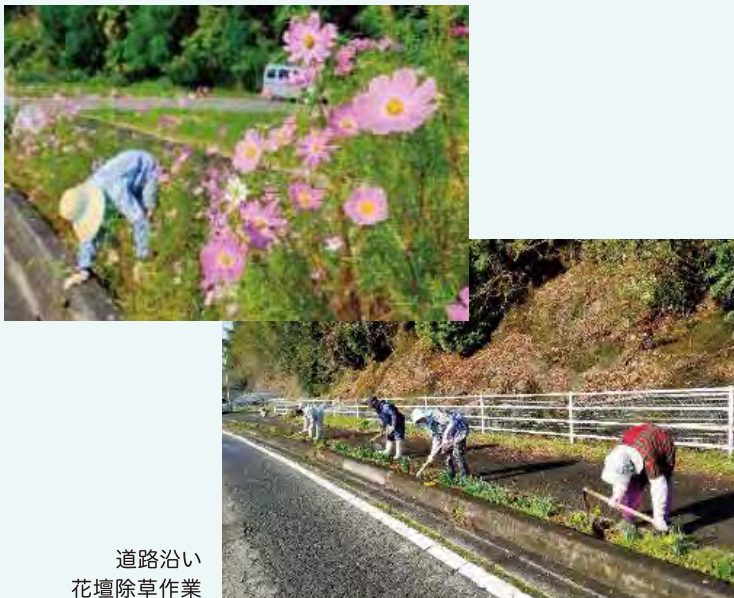
道路沿い 花壇除草作業

個々の自覚と協力のおかげで感染者も出さずことなく令和3年度を終えることができました。令和4年度は「健康づくり」「友愛活動」「奉仕活動」を通じて、明るく豊かで活力あるシニアライフを目指し、地域をささえあう、各地区老人クラブの協力をいただきながら組織の強化の推進活動を進めていきます。