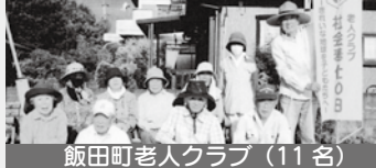
飯田町老人クラブ（11名）