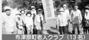
布津原町老人クラブ（13名）