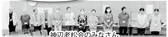
神辺老松会のみなさん