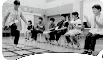
みんなで歌に合わせて♪

感想を書いてもらっています。9月の神辺教室では、会員の皆さんはステップも軽やかで、笑いの中で終わりました。