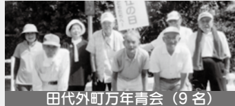
田代外町万年青会（9名）