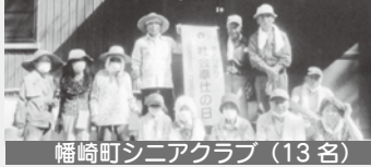
幡崎町シニアクラブ（13名）