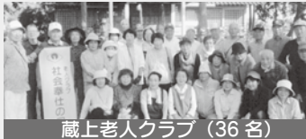
蔵上老人クラブ（36名）