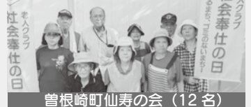
曽根崎町仙寿の会（12名）