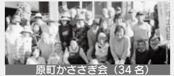
原町かささぎ会（34名）