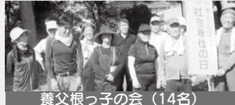
養父根っ子の会（14名）