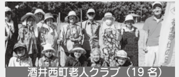
酒井西町老人クラブ（19名）