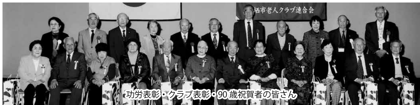
功 勞 表 彰 ・ ク ラ ブ 表 彰 ・ 90 歳 祝 賀 者 の 皆 さ ん