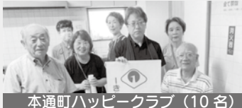
本通町ハッピークラブ（10名）