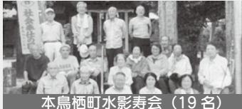
本鳥栖町水影寿会（19名）