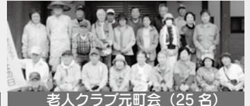
老人クラブ元町会（25名）