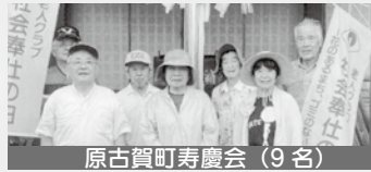
原古賀町寿慶会（9名）