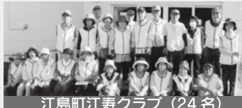
江島町江寿クラブ（24名）