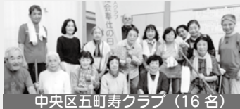
中央区五町寿クラブ（16名）