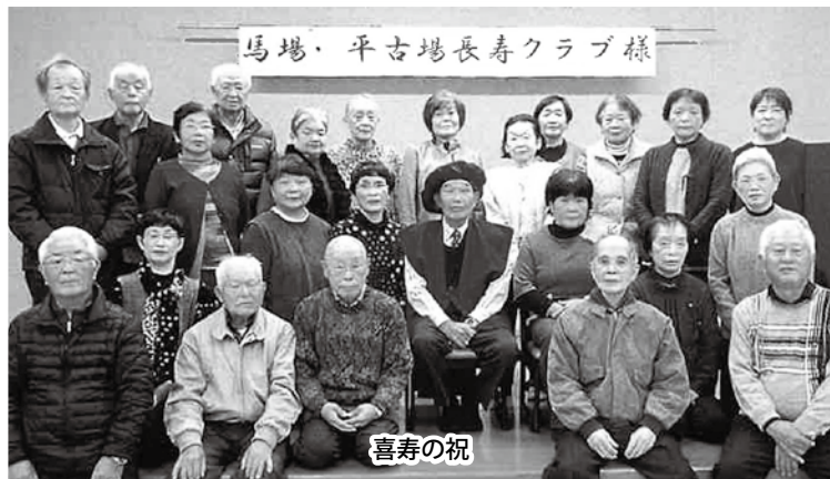
馬場・平古場長寿クラブ様

会員の年齢差は大きいものの、昔からの付き合いがあることからもめごとはなく、和気あいあいとした雰囲気ですが、会員の高齢化により活動範囲が狭まり、働き方改革や定年延長が影響し新規加