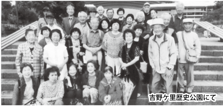
吉野ヶ里歴史公園にて