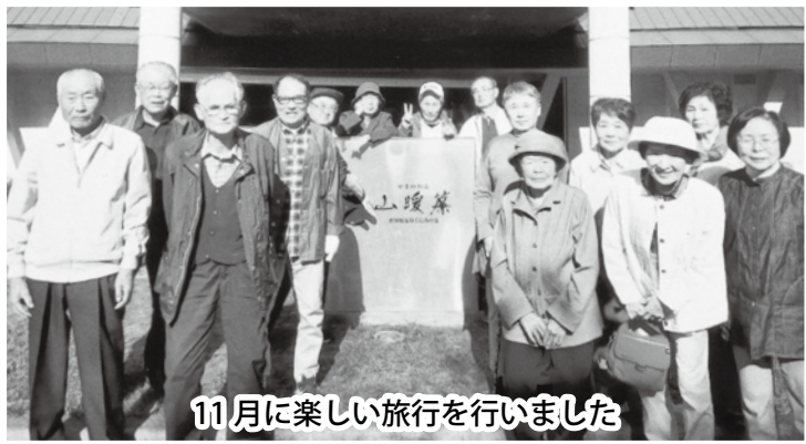
11月に楽しい旅行を行いました

手ぶち作り」等を行って います。 研修旅行はコロナ禍で 5年中止になっていま したが、昨年は長崎県の 世知原温泉「山暖簾」行 きを計画したところ14人 の参加があり、天空の温 泉で美味しい料理を食べ ながら楽しいひと時を過 ごしました。 当長命会は「明るく、 楽しく、助け合う」を合 言葉に活動しています。 八並区は今年で839年 目となる武雄流鏑馬の幸 領区となっており、その 折にはしめ縄作り、的竹