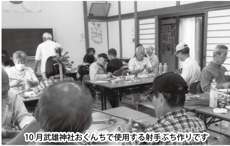
10月武雄神社おくちで使用する射手ぶち作りです

年11回の定例月例会を中 心に、水道公園の清掃奉仕 作業を年6回、研修旅行を 年1回、7月には物故者慰 霊祭、10月には流鏑馬「射