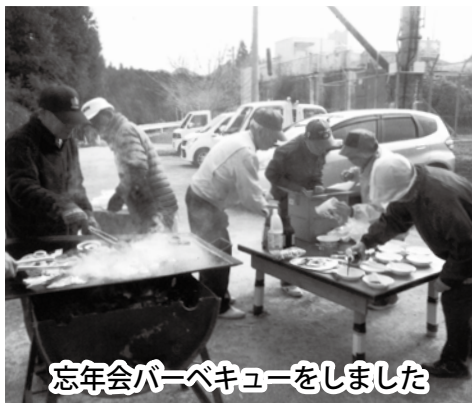
忘年会バーベキューをしました

春には公園の回りに、桜、つつじの花が咲くころ、弁当を取って花見をしたり、12月には忘年会にバーベキューをして交流を深め、スポーツを通して地域づくり、仲間づくり、健康づくりをしています。