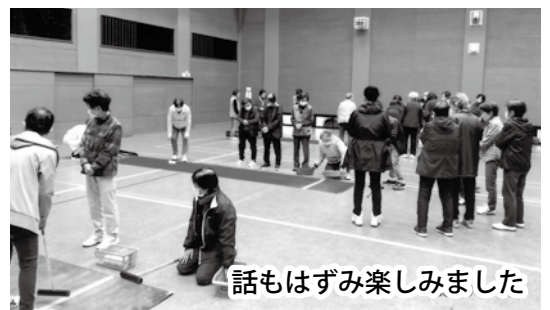
話はずみ楽しみました