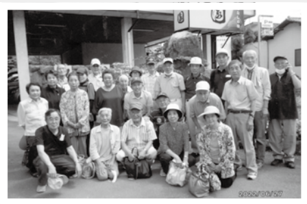
年1～2回旅行を実施（嬉野町にて）