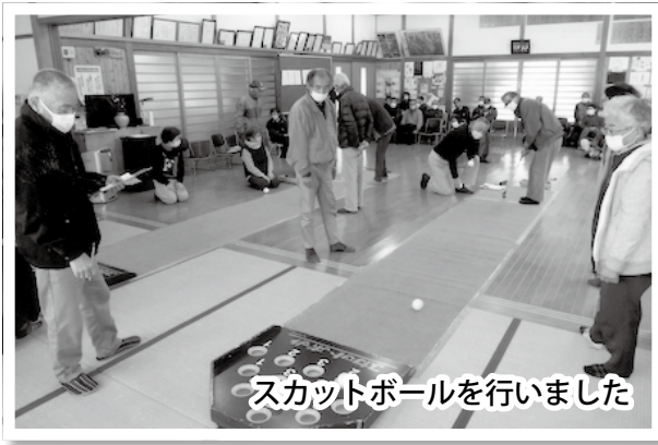
スカットボールを行いました

も令和6年度から始めました。第1回目は近くのコンビニで住民票などを交付してもらった体験ツアーを実施し、例会で報告しました。 今一番の課題は、新入会員の加入促進です。そのためにも例会に1人でも多くの会員に参加していただくための工夫をし、スポーツ行事などで子ども会などの世代間交流を行っています。地域で会の話題が出るような老人クラブを目指しています。