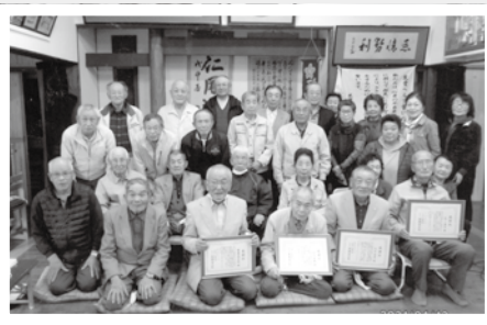
10年以上役員をされた方に感謝状を贈呈