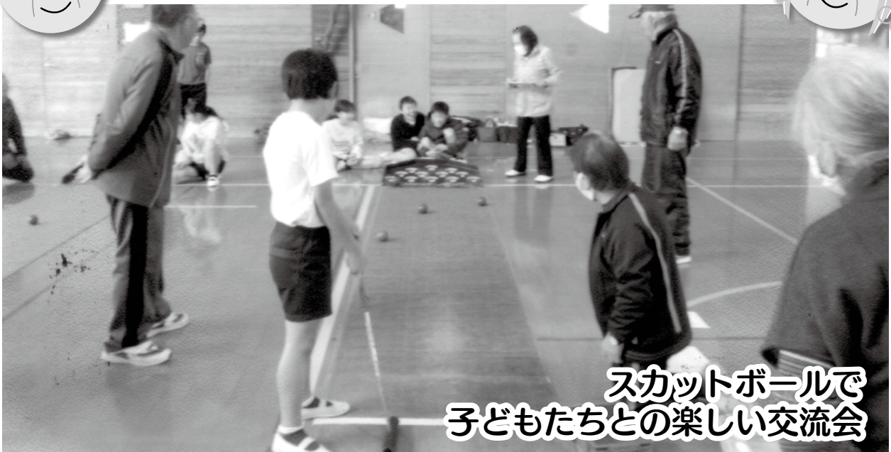
スカットボールで子どもたちとの楽しい交流会

12月3日にサロン及び次世代育成事業として、「皆で楽しく遊ぼう」を行いました。参加は若木小5年男女9名、民生委員5名、町老連（女性部長主体）6名でした。 種目はスカットボール。時間の経過と共に、会場もにぎやかになり、特に小学生は興味が一段と大きかった様です。参加者全員満足して終了する事ができました。 今回の催しは町老連8月の理事会において民生委員との交流会を持った事が切っ掛けでした。又、次回にも期待したいものです。