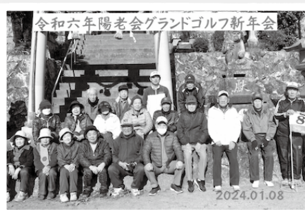
新年グラウンド・ゴルフ大会（山王神社にて）

「健康で100歳」を目標にまずはおしゃべり、体を動かす、思いやり、学び事など仲良く楽しんでいきます。