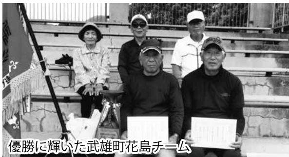
優勝に輝いた武雄町花島チーム