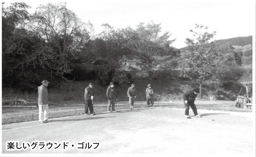
楽しいグラウンド・ゴルフ

矢筈は神六山の麓にあり、時折り目の前に雲海を見ることがあります。 春になると矢筈ダム周辺では桜が満開になり、多くの人々が花見に訪れ楽しんでおられます。 矢筈区ではダム周辺の草刈り作業をして清掃活動を続けております。