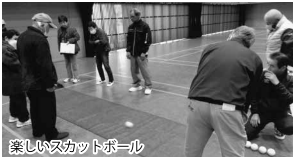
楽しいスカットボール