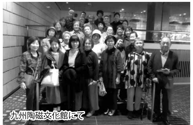
九州陶磁文化館にて

次に、世界に誇る磁器 の最高峰「柿右衛門ギャ ラリー」に。大きな黄赤色 の実が、たわなに生ってい る2本の柿の木に歓声を上 げ、全員で記念撮影。満足 満足。柿右衛門様式の作品、 作成の工程を見学。濁手と 呼ばれる乳白色の素地に描 かれた赤・青・みどり・黄 などの鮮やかな彩色を施し た器に見惚れてしまい、ご 飯茶碗を買ってしまった。 ランチ・懇談は、「ギヤ ラリー有田」にて、呉豆腐 定食を頂き、有田の味を味