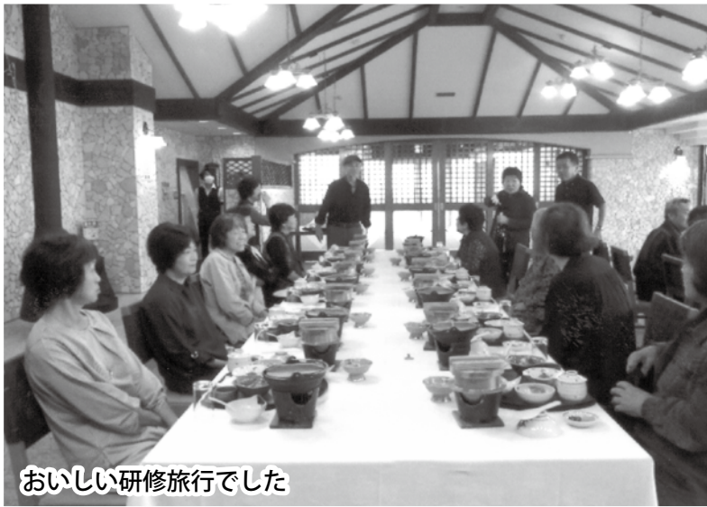
おいしい研修旅行でした